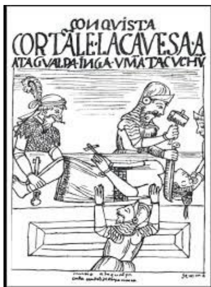
Figura 2 - Dibujo que representa la degollación Inca Ataw Wallpa

Fuente: Guamán Poma de Ayala, 1966, p. 24.